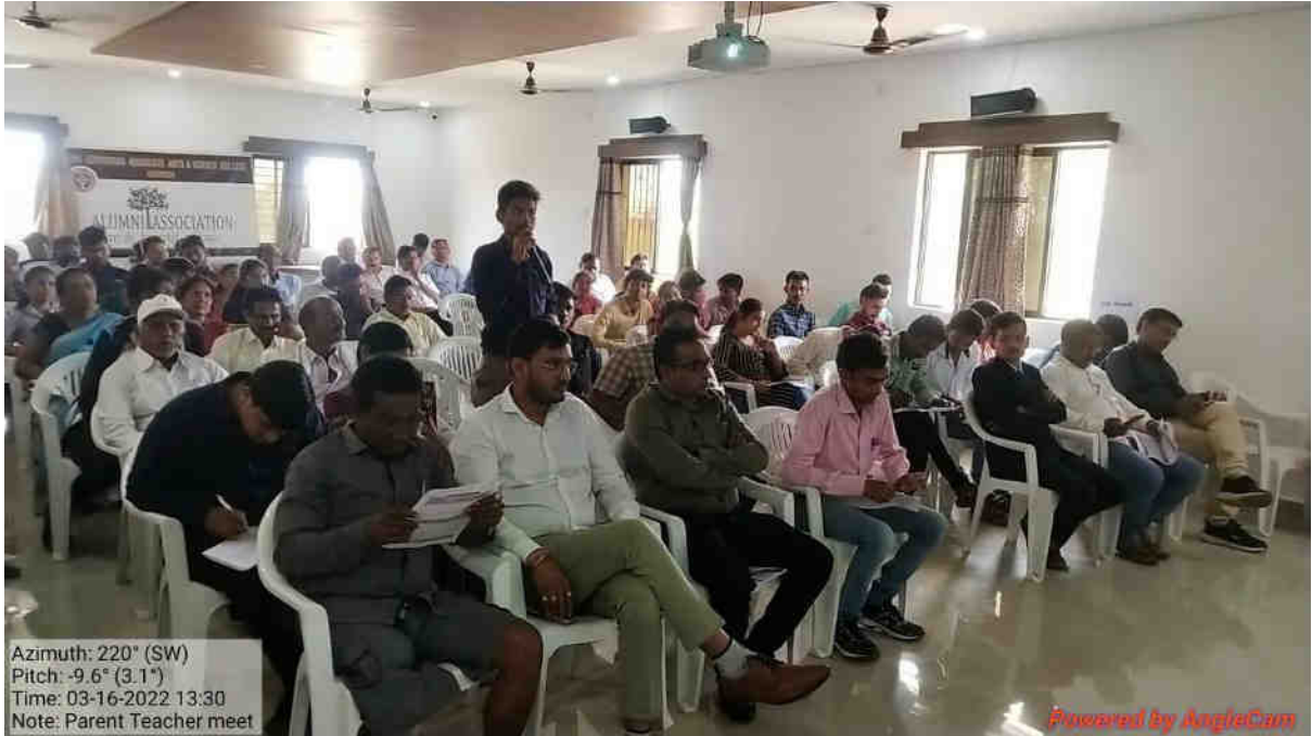
Azimuth: 220° (SW) Pitch: -9.6° (3.1°) Time: 03-16-2022 13:30 Note: Parent Teacher meet