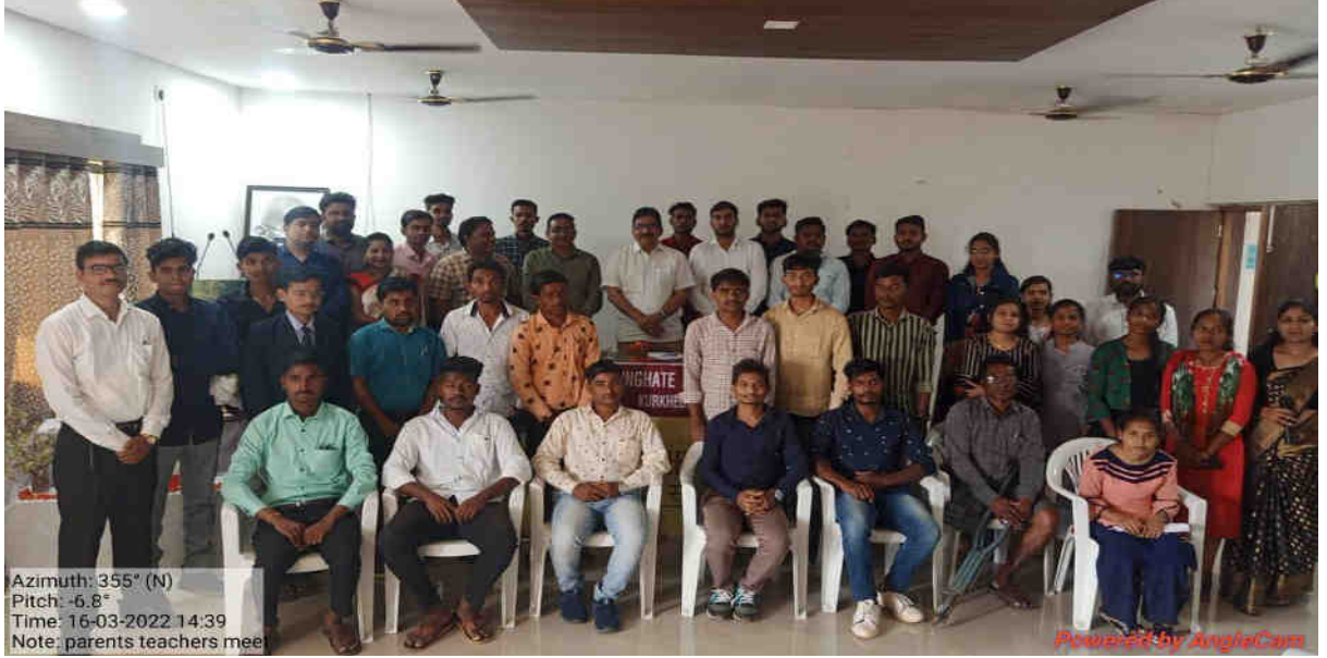
Azimuth: 355° (N) Pitch: -6.8° Time: 16-03-2022 14:39 Note: parents teachers mee