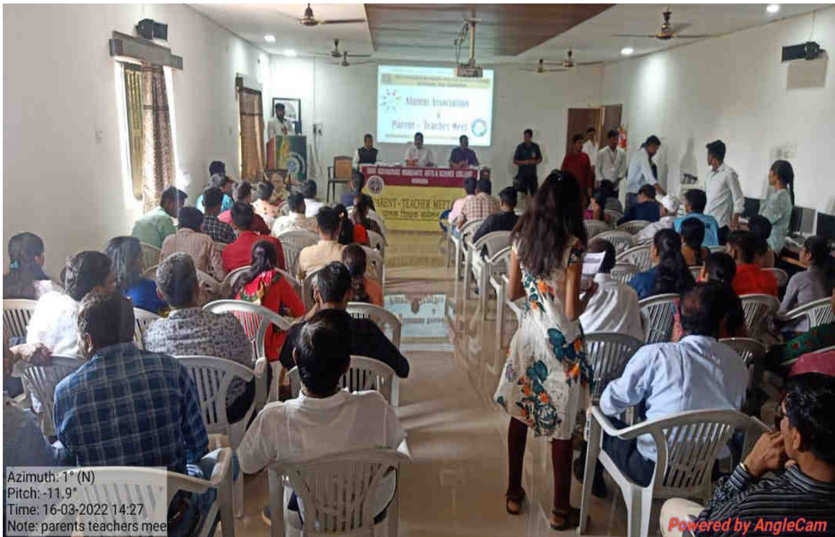
Azimuth: 1° (N) Pitch: -11.9° Time: 16-03-2022 14:27 Note: parents teachers mee